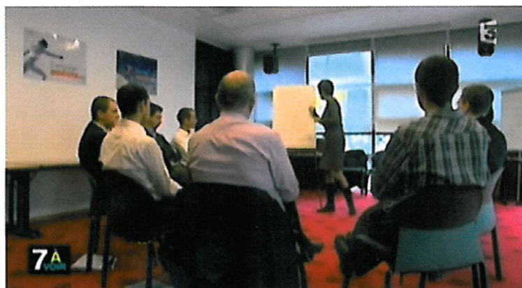
Session de Lyon, filmée par France Télévision

« Ce fut une véritable prise de conscience sur la manière de développer mon écoute. Basée sur des principes d'ouverture et d'empathie, la CNV est une manière d'enrichir sa relation avec les autres dans le respect de nos différences. J'en ressors impacté et avec le sentiment d'avoir partagé une extraordinaire aventure avec tous les participants. A institutionnaliser ! »